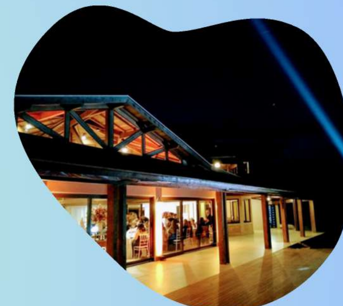
Eventos até 200 pessoas